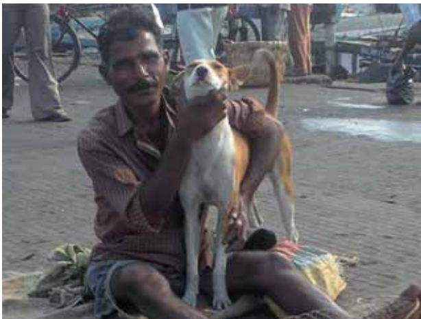
インドにおける、漁師と地域犬