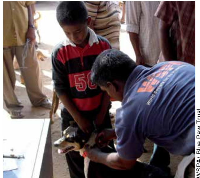
スリランカにおいて、狂犬病予防接種と寄生虫の治療を受けた犬に、個体識別のための赤い首輪をはめている様子