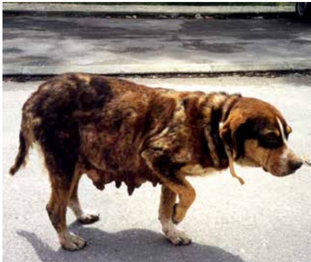
ポルトガルにおける、所有されているが、自由に歩き回ることができる犬

行動が制限されている犬及び放浪している犬双方に関連する福祉の問題も存在する。しかし、この資料の目的のため、犬の個体数管理を、「必要と考えられた場合における個体数規模の減少を含む、放浪犬の個体数及びこれが呈するリスクの管理」と定義する。