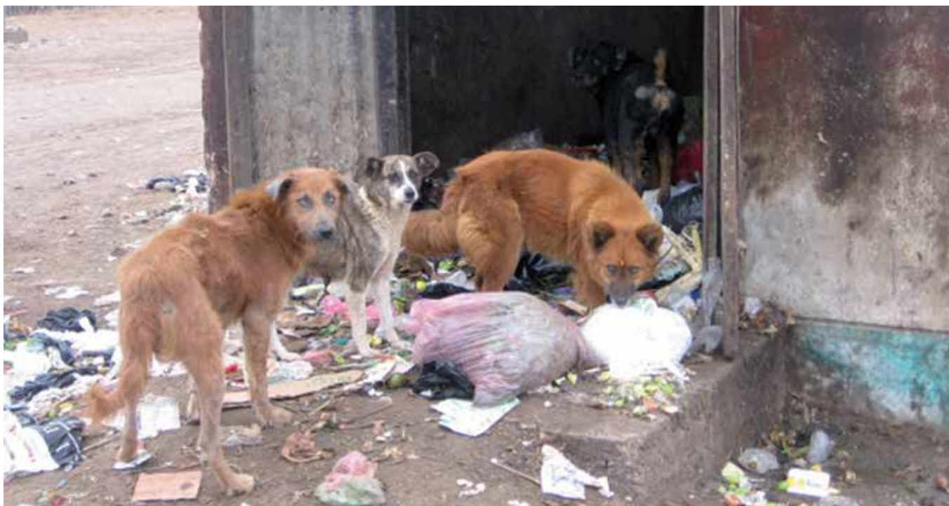
ゴミから餌を探しているペルーの放浪犬