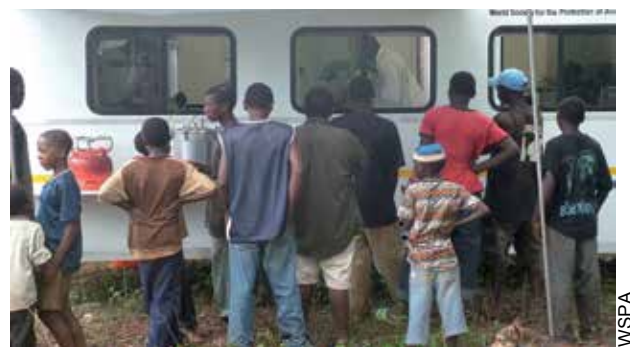
ザンジバルにおいて、移動式クリニックの窓をのぞき、避妊・去勢手術を見ている地域住民たち。

2006年、WSPAと地方自治体が避妊・去勢に関する介入をザンジバルにおいて実施したときに、似たようなことが起こった。介入初期は、コンプライアンスも低く、避妊・去勢するために動物を積極的に連れてくる飼い主は少なかった。しかし、数か月経つと、教育プログラム、鍵となる地域の代表者との話し合い、そして実際に避妊・去勢された動物の良好な健康状態の実例などが、人々の態度を変容し、人々が積極的に、避妊・去勢のために動物を連れてくるようになった。